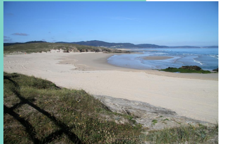
Praia da Amela