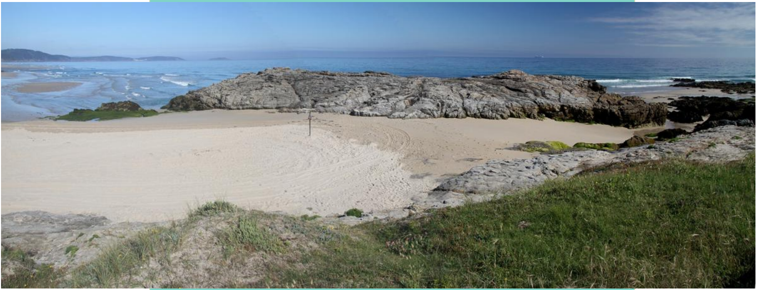
A Pedra do Sal