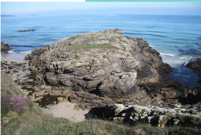
Illote do Castelo