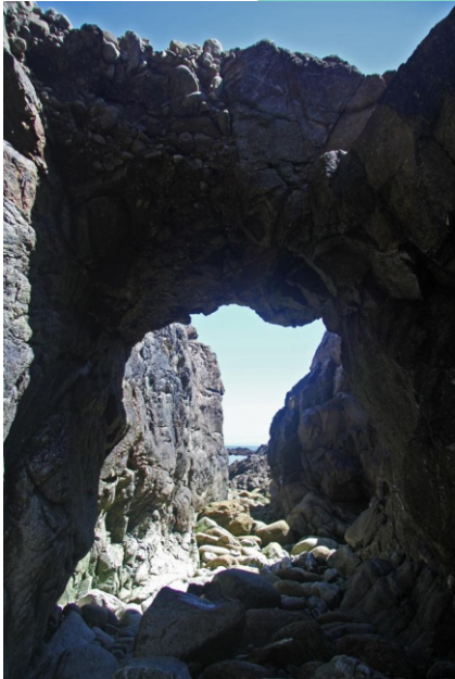
Arcos nas proximidades da Furna Furada