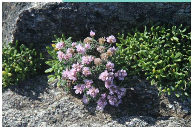
Herba de namorar