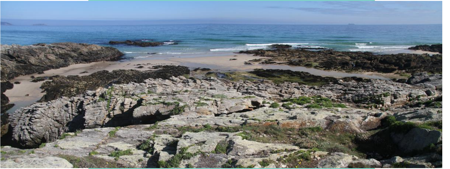
Furna do Corvo