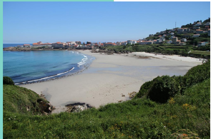
Praia do Caracoleiro e Caión