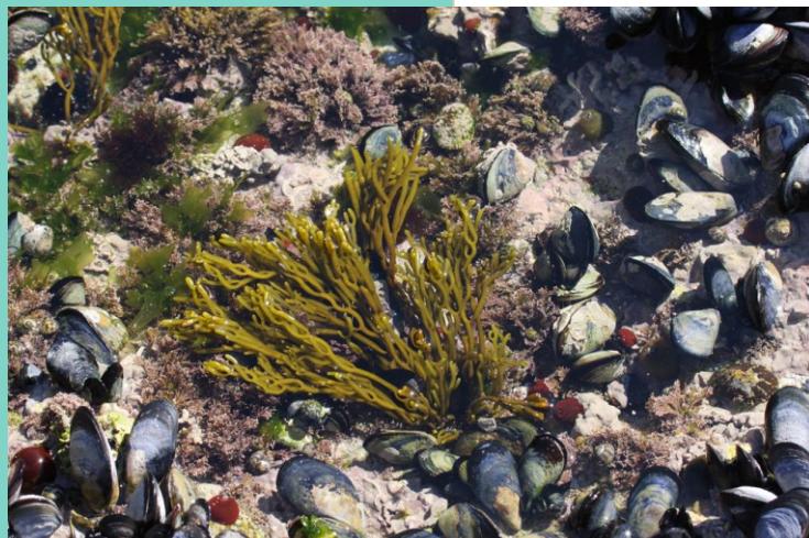
Algas, mexillóns, chuponas, lapas...