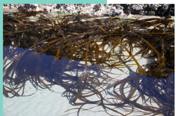
Golfos nunha poza de marea