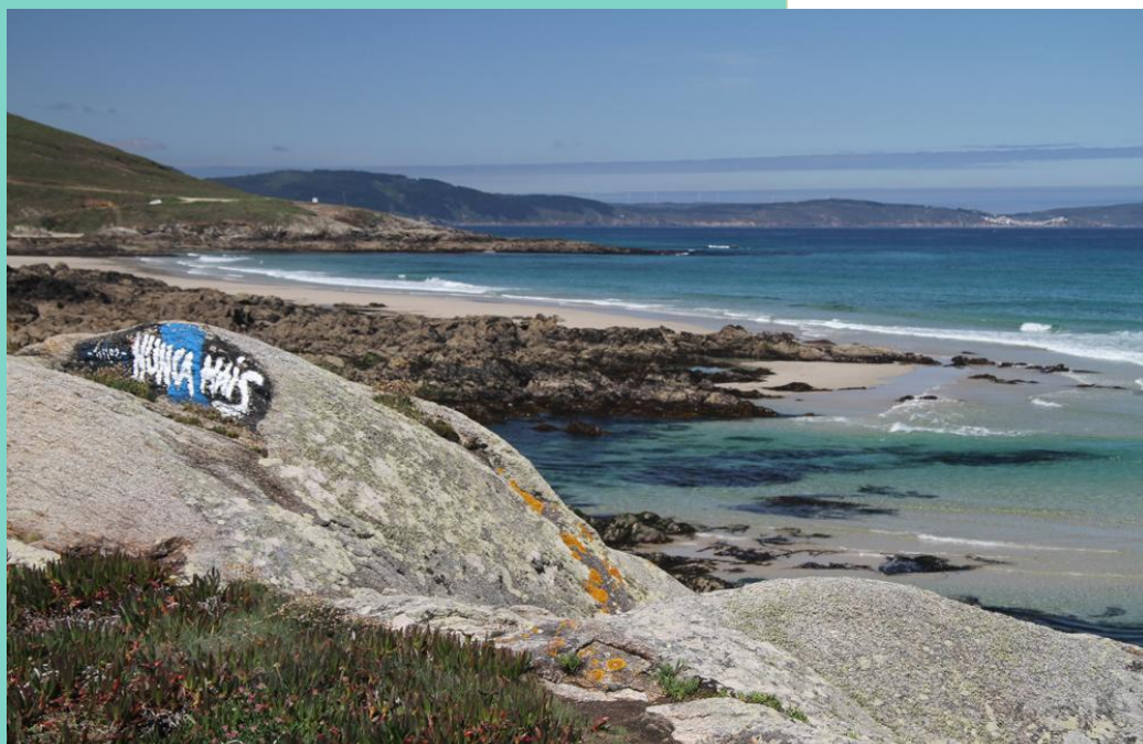
Praias de Leira e A Arnela